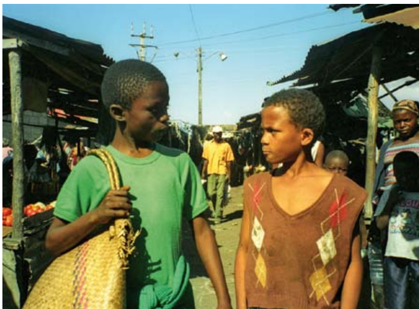
Der grosse Markt – o grande Bazar

Licínio Azevedo, Mosambik 2006. Dokumentarischer Spielfilm, DVD, 56 Min., Portugiesisch/Deutsch, d/f/e unternitelt, ab 10 Jahren Preis: Fr. 40.– / 70.–*