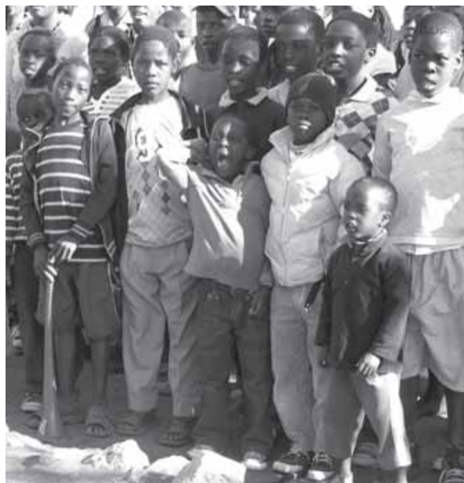
DM-échange et mission

DM-échange et mission ist im südlichen Afrika in Angola, Mosambik und Südafrika tätig. Die Zusammenarbeit mit den Partnerkirchen hat die Förderung ihrer ganzheitlichen Präsenz unter der Bevölkerung zum Ziel. Daraus ergeben sich die vier nachfolgenden Schwerpunkte: