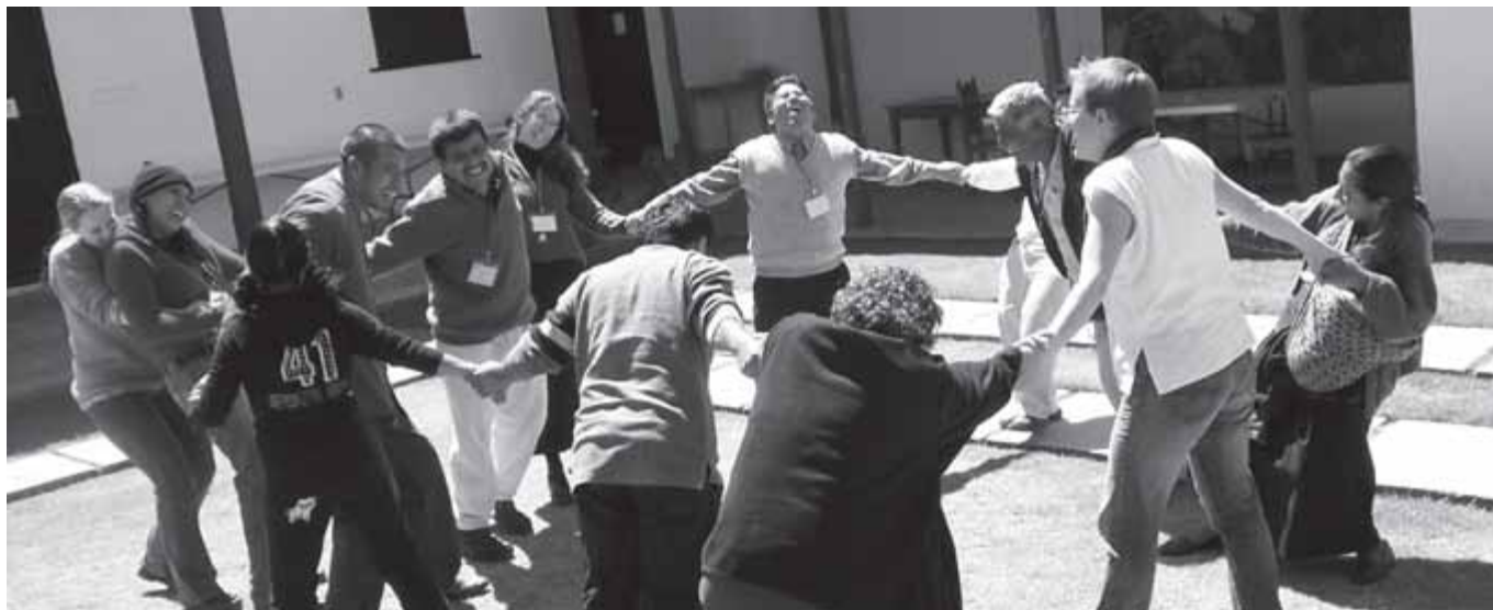
DM-échange et mission

Die Arbeit des Lokalpartners wird durch Freiwilligeneinsätze regelmässig unterstützt. So wird die die Nord-Süd-Kommunikation verbessert und die lokalen Kompetenzen sowie die Erfahrungen der Freiwilligen verstärkt.