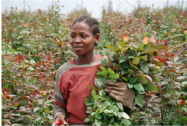
Blumenarbeiterin in Kiliflora

Bilder dazu finden sich auf der Medienseite von www.brotfueralle.ch