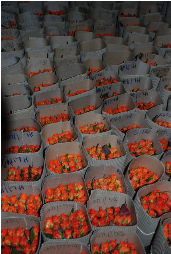
Vor dem Abtransport