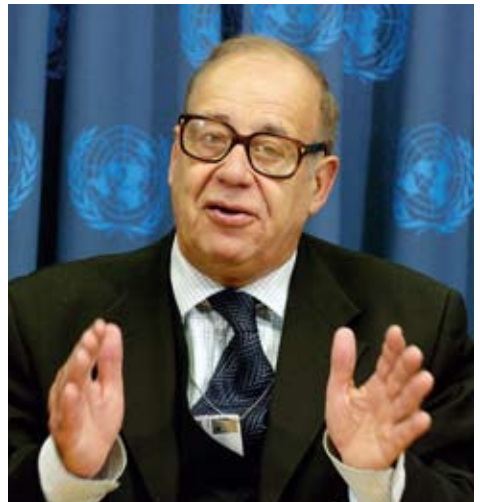
Jean Ziegler bei einer UN-Pressekonferenz in New York.

Ziegler: Georges Bernanos hat geschrieben: «Gott hat keine anderen Hände als die unseren.»*** Wir leben in einer Demokratie und müssen uns dafür einsetzen, die mörderische Weltordnung zu ändern. Es liegt an uns zu handeln. Die Schweizer Regierung vertritt uns bei den Vereinten Nationen, dem IWF, der Weltbank und der WTO. Wir müssen Druck auf unsere Regierung ausüben, dass sie sich innerhalb all dieser Organisationen für das Recht auf Nahrung einsetzt. Ausserdem können wir als Konsumenten Druck auf grosse Konzerne ausüben, die absurderweise von der Nahrungsmittelkrise profitieren.