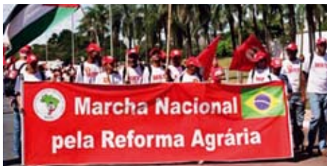
Marsch der Landlosen nach Brasilia. Die Landlosen fordern die brasilianische Regierung auf, die im Gesetz verankerte Agrarreform durchzuführen.

→ Hier ist Vorsicht geboten, da eine bloße Steigerung der landwirtschaftlichen Produktion im grossen Stil, so wie es einige Vertreter dieses Konzepts fordern, den Hunger nicht wirksam beseitigt, hingegen die am meisten betroffenen Kleinbauern und -bäuerinnen übergehen und in erneute Abhängigkeit stürzen kann.